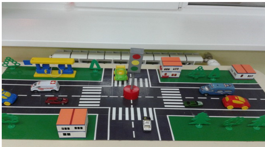
Макет “Улицы города”