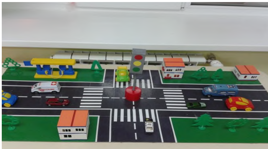
Макет “Улицы города”