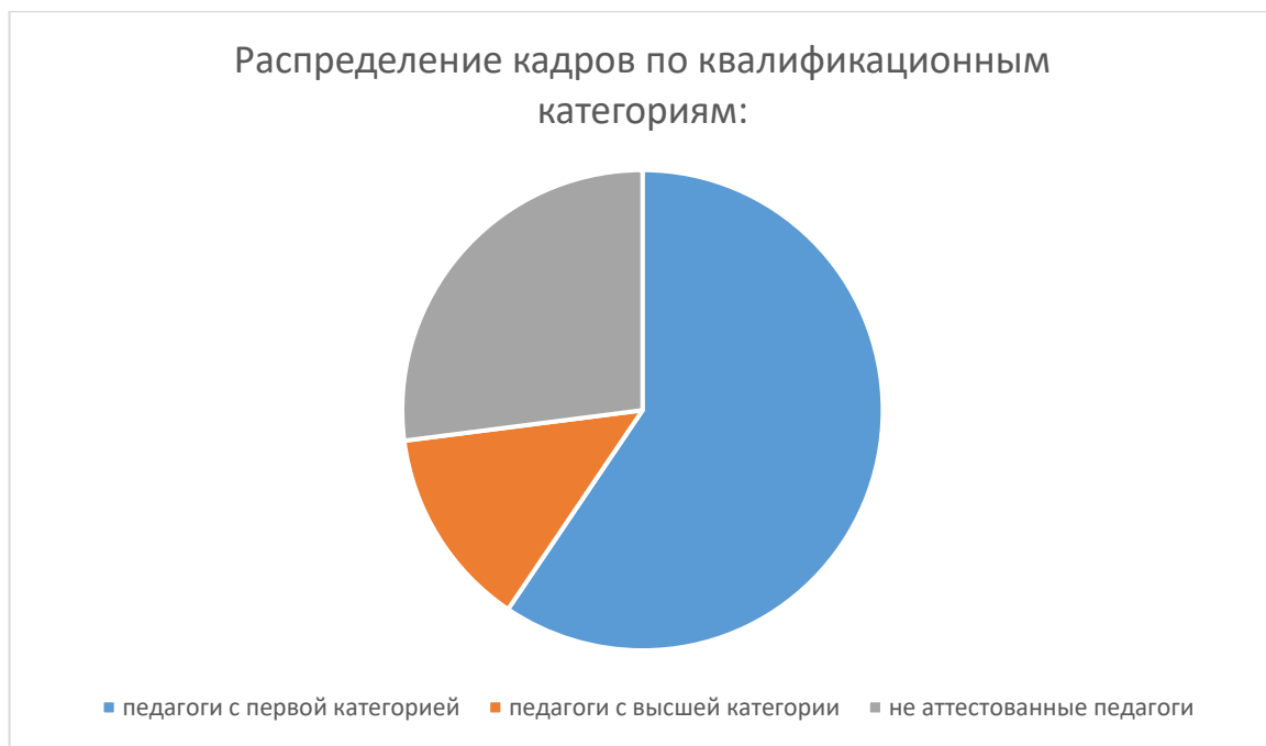
Распределение кадров по квалификационным категориям: